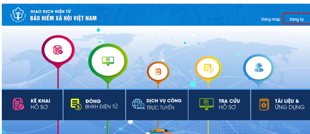
Hình 2.1. Màn hình trang chủ

Bước 2: Trên màn hình trang chủ, chọn “ Đăng ký ” để hiển thị màn hình đăng ký trên Cổng Dịch vụ công: