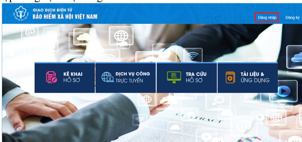
Hình 1.1. Màn hình trang chủ

Bước 2: Trên màn hình trang chủ, chọn “ Đăng nhập ” để hiển thị màn hình đăng nhập cổng dịch vụ công